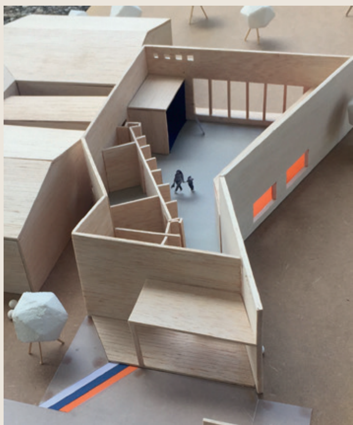
Maquette 3D de la future salle disponible en mairie.

Pour mémoire, une fois terminé, le projet apportera beaucoup de confort aux enfants. Les espaces sont pensés pour eux :