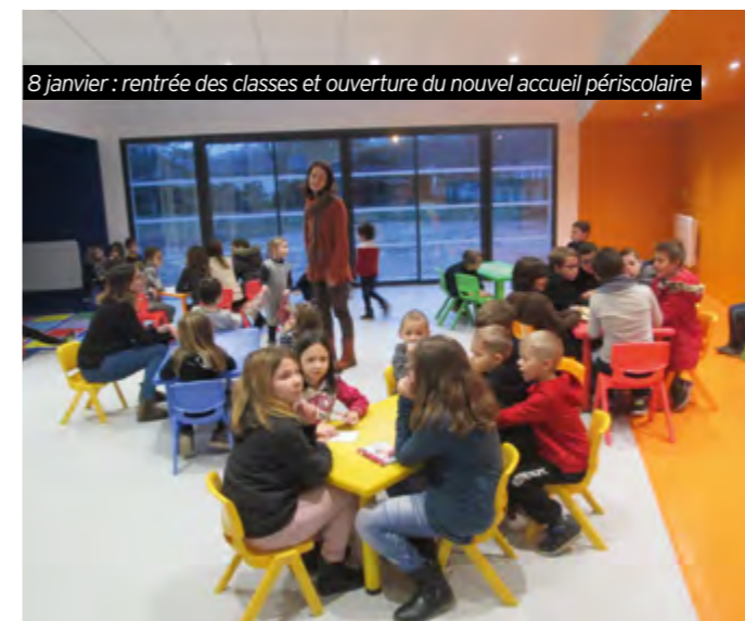
8 janvier : rentrée des classes et ouverture du nouvel accueil périscolaire

M.A : C'est un lieu qui a été pensé pour les enfants avec des rangements, des toilettes intégrées et surtout la possibilité pour nous les adultes d'avoir toujours un oeil sur eux.