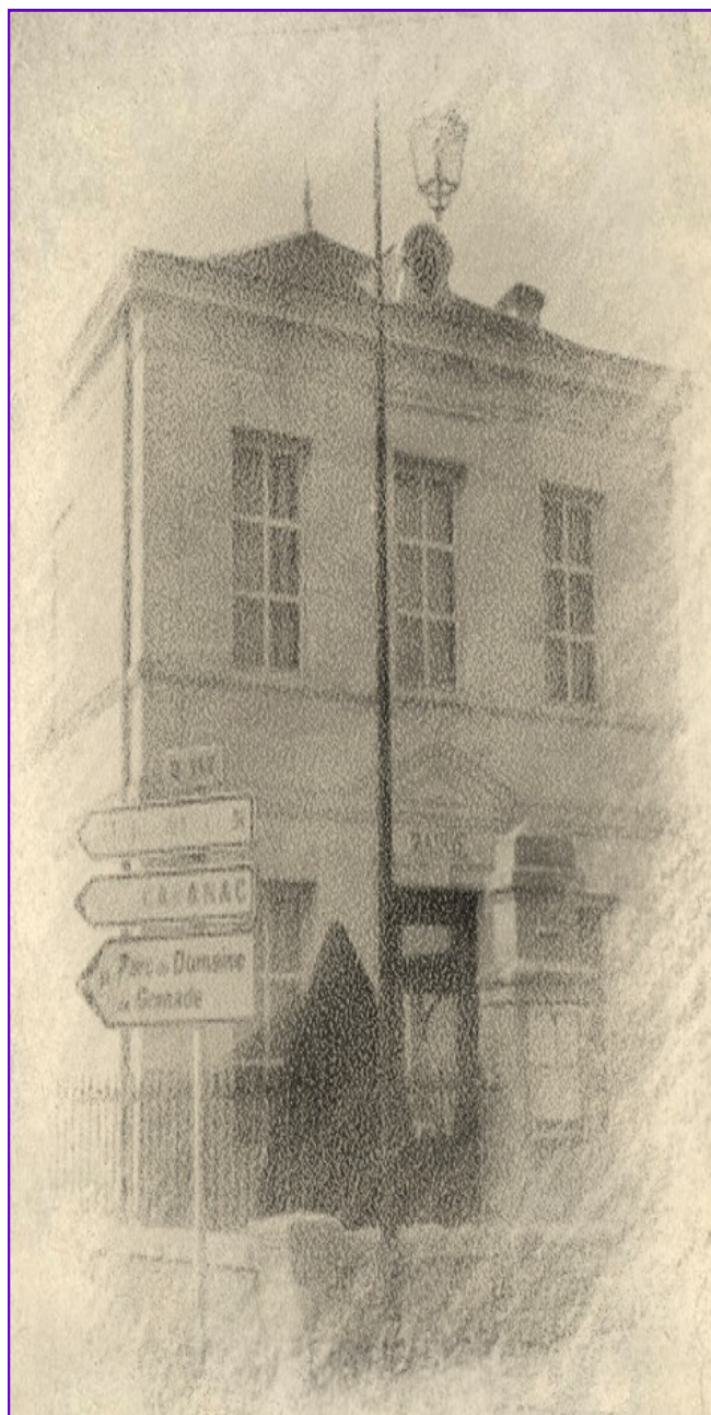
Mairie de Saint-Michel de Rieufret

Imprimé par nos soins, ne pas jeter sur la voie publique